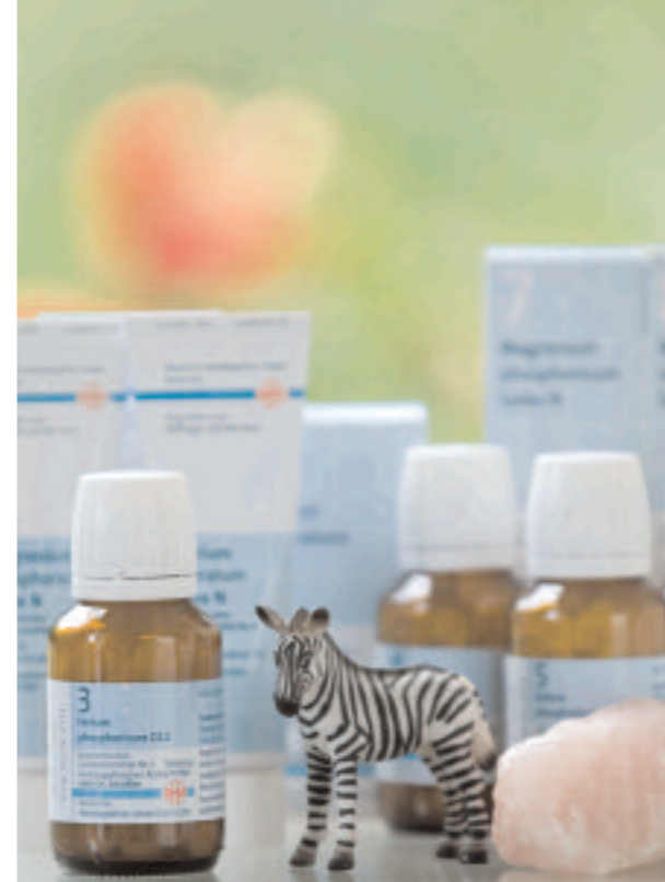
Schnell das richtige Salz zur Hand: das Schüßler-Regal

Mit Freude groß werden: 46 Kinder sind im Kinderdorf zu Hause