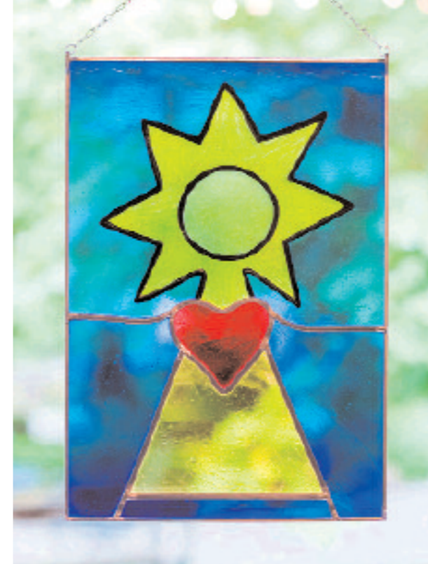
Stern mit Herz – das Logo des Erich-Kästner-Kinderdorfes

Im Garten der Steinmühle haben kleine und große Kinder Spaß