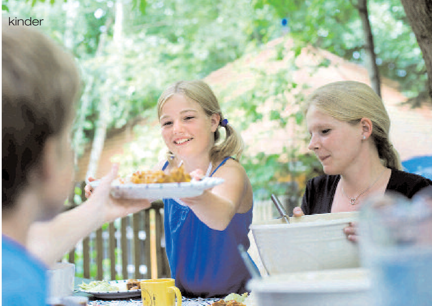
Mittagessen auf der Terrasse der Steinmühle, das Hirtenhund Olivia (u.)